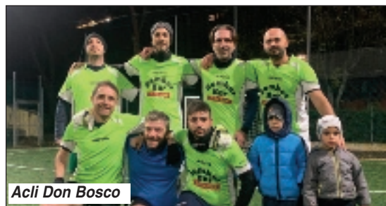
Acli Don Bosco