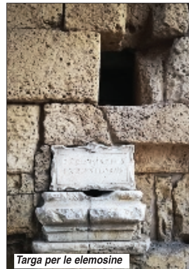
Targa per le elemosine

Come è facile intuire, il momento della giornata in cui normalmente l'infante veniva abbandonato era dopo la mezzanotte, quando