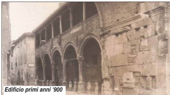
Edificio primi anni '900

La struttura fanese può essere considerata a tutti gli effetti un brefotrofo, istituto che accoglieva e allevava i neonati illegittimi, abbandonati o in pericolo di abbandono e che si distingueva dall'orfanotrofo, che era invece la struttura di accoglienza dove venivano ospitati ed educati i bambini orfani e a cui venivano anche affidati minori abbandonati o mal-