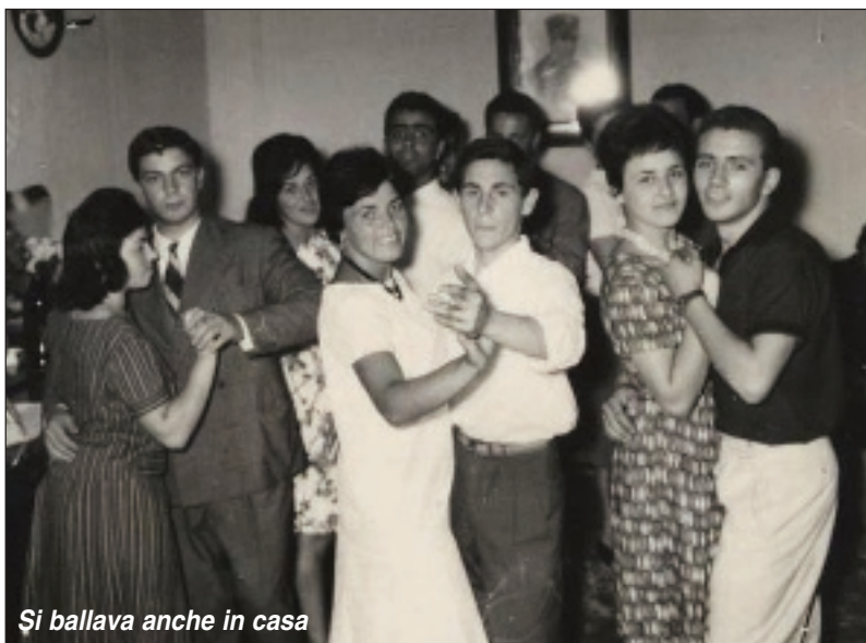
Si ballava anche in casa