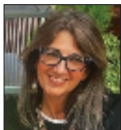
di Manuela Palmucci Guida turistica abilitata Autorizzazione n°2222 Regione Marche

Il docente, lo studente o semplicemente il visitatore che per la prima volta accedesse agli spazi del complesso del San Michele, verrebbe sicuramente attratto dalla bella loggia rinascimentale, dall'atrio con soffitto a cassettoni, dal porticato con colonne in pietra bianca sormontato da un loggiato decorato con pilastri snelli e caratterizzato da una piccola finestra di pregevole fattura. Verrebbe naturale chiedersi a chi fosse destinato quell'edificio così antico, sede odierna di una facoltà universitaria così moderna. I documenti di archivio ci attestano che già dalla fine del 1400 quel palazzo a ridosso dell'arco di Augusto aveva dato ospita-