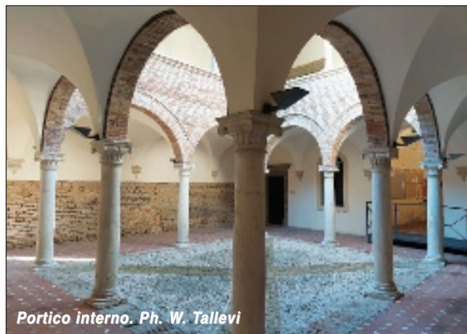
Portico interno.