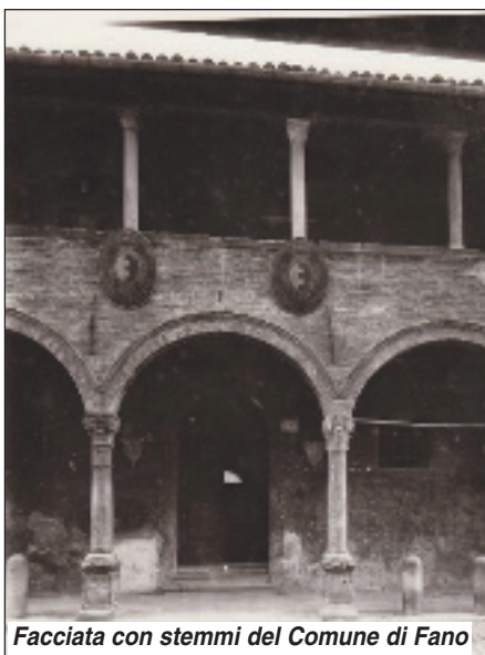
Facciata con stemmi del Comune di Fano

La parola deriva dal latino brephtrophium , derivata dal greco brephtrophéion , composto di bréphos (neonato) e tréphein (allevare, nutrire). Si ritiene che in Italia la prima struttura di pubblica assistenza organizzata e attrezzata dal punto di vista igienico, sanitario e sociale sia sorta a Milano nel 787, anche se l'origine dei brefotrofi sembra comunque risalire ai primi secoli del Cristianesimo, con una maggiore diffusione a partire dall'alto medioevo, quando le comunità monastiche cominciarono a fondare organizzazioni di natura non solo religiosa ma anche assistenziale. Con l'istituzione di strutture atte a garantire il ricovero e l'assistenza di bambini abbandonati o in stato di bisogno, vennero costruite all'esterno sulle facciate dei fabbricati le cosiddette ruote degli esposti, congegni girevoli nel quale il neonato poteva essere lasciato senza che dall'interno si potesse riconosce-