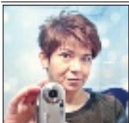
di Roberta Pascucci