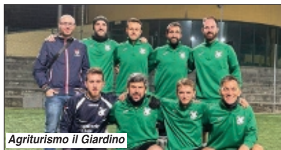
Agriturismo il Giardino