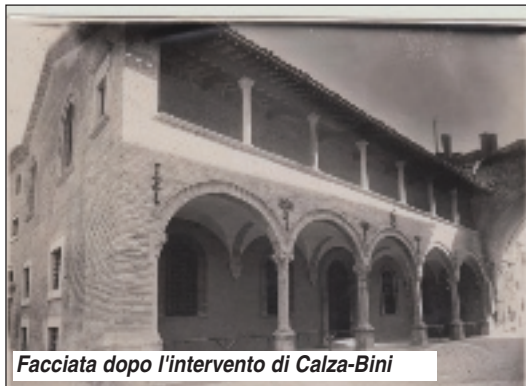
Facciata dopo l'intervento di Calza-Bini

Nella nostra città la ruota venne eliminata il 1° luglio del 1873 e il foro venne per un certo periodo tamponato con delle pietre, come si evince